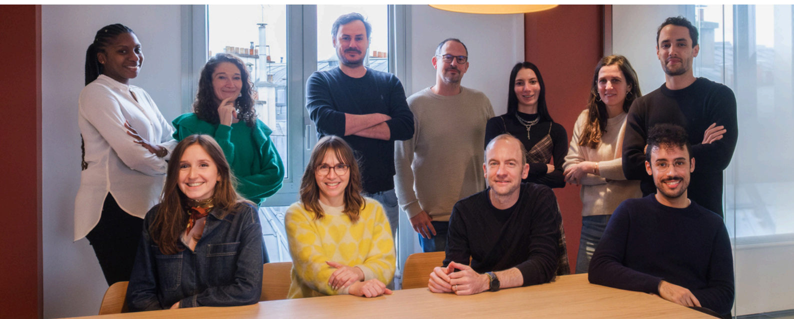
Team Office Rogervoice